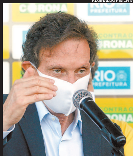
Crivella já pediu informações ao TRE

Já a Prefeitura de Duque de Caxias, na Baixada Fluminense, informou que em virtude da pandemia as cidades estão vivendo um momento grave e de urgente necessidade pública. E complementa: “Assim que a Justiça Eleitoral solicitar ao Congresso Nacional a alteração da data das eleições deste ano, por conta da covid-19, se a solicitação for aceita, não será mais